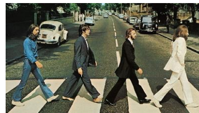
と〜っても有名な4人組 すぐにわかる人は昭和の人？