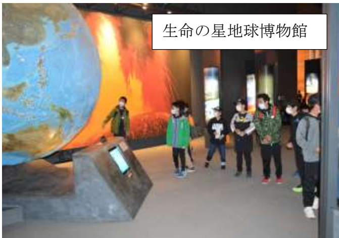
生命の星地球博物館