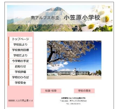
↑ 本校のホームページです。

などの話をしていただき、入学に向けて、ワクワクするような気持ちをもってほしいと思っております。右ページに「校長あいさつ」としてスライドで紹介する予定であった、今年の1年生の様子の一部を掲載しますので、親子で一緒にご覧いただき、小学校入学への期待を高めていただければと思います。