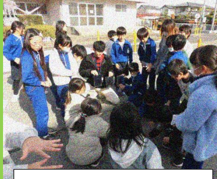
理科「日光をあつめよう」