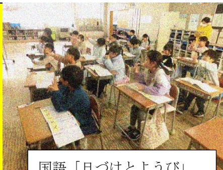
国語「日づけとようび」