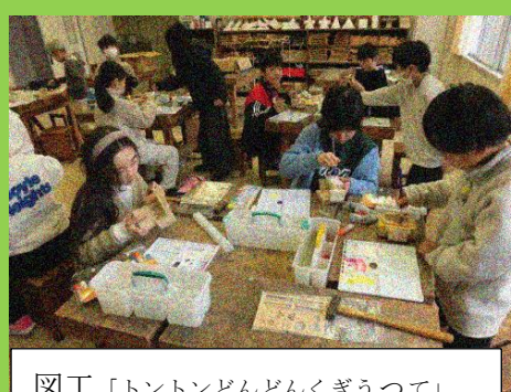
図工「トントンどんどんくぎうつて」