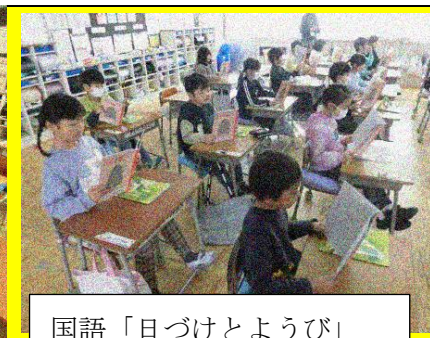
国語「日づけとようび」